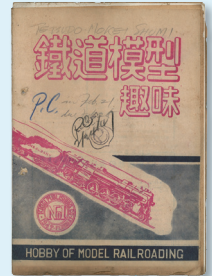
GHQによる検閲済のスタンプが押されたTMS創刊号原本。

『鐵道模型趣味』孔版1号出版から80年。戦後の鐵道模型界を牽引し続けてきたTMS。昨年記念すべき通巻1000号を達成した本誌のみならず、知られざる数々の別冊・書籍など、機芸出版社の歩みを未公開の史料で振り返ります。烏口で描かれた精密図面の現物展示も必見です。