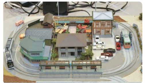
岡山東山周回軌道 ●中込 浩二さん 岡山電気軌道東山車庫周辺をイメージ