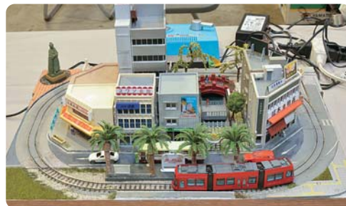
土佐電鉄風レイアウト ●中込 浩二さん はりまや橋及び移転前の高知駅前電停をイメージ