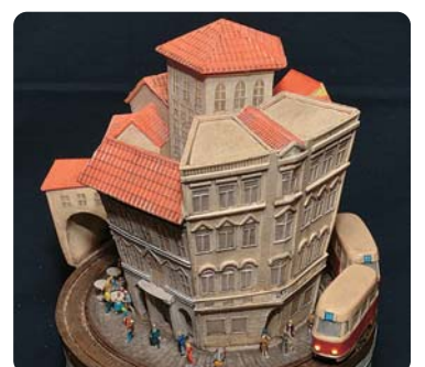
Praha Tramvaje ●久原 聡さん 美しいプラハの街並みと路面電車のジオラマ