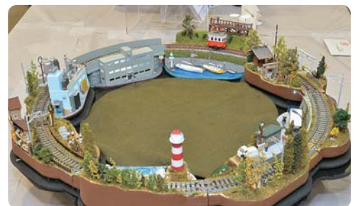
ジオラマサーカス ●M8有志メンバー 有志メンバーが制作したKATOのミニジオラマ